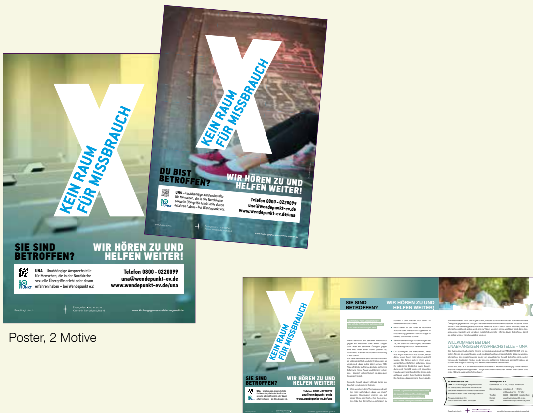
Poster, 2 Motive

→ www.kirche-gegen-sexualisierte-gewalt.de